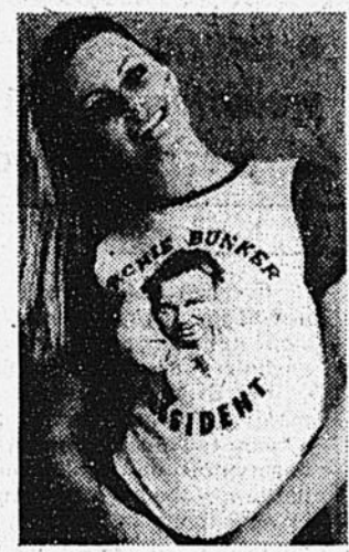
Secevano erano quelle dei «colleges» americani o delle associazioni sportive. Fu la contestazione giovanile a creare il boom delle magliette stampate.

Sino a dieci anni fa nessuno si sarebbe mai sognato di indossare una maglietta con un nome o la faccia di un personaggio. Le uniche che si cono-